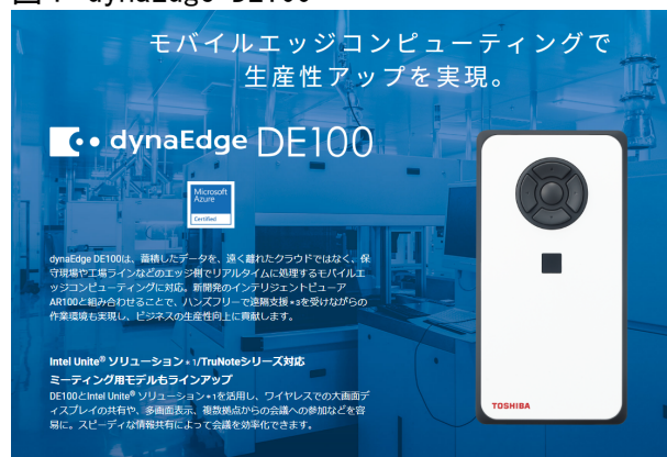
図4 dynaEdge DE100

労働力不足の中での効率的な技術・ノウハウ習得、多様な働き方に対応するコミュニケーションツールの必要性などの社会的課題を解決するモバイルエッジコンピューティングデバイスへの期待がさまざまな業種・業態において高まる中、弊社はノートPC 事業で培った高密度実装技術をもとに、様々な環境でエッジコンピューティングを可能にする「dynaEdge DE100 4) 」を商品化した。(図4)