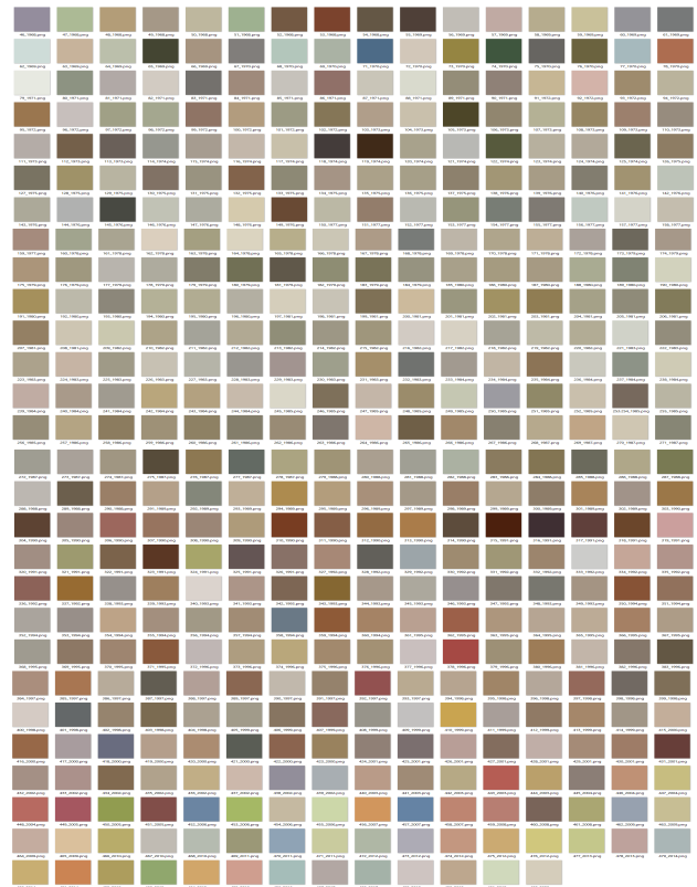
図3. 表紙の色彩の平均色の一覧

『DREAM』は、インテリアに対し、人々が気づけていない、気づかずにいる部分を表紙写真に込めて届けられてきたことが編集長の言葉を通して明らかになった。半世紀に渡る社会の変化