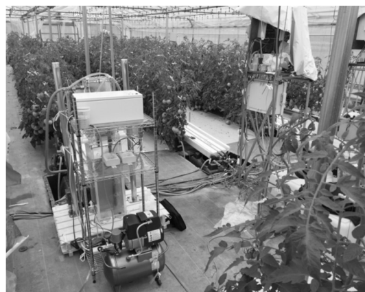
Fig. 2. ビニールハウス栽培中での水耕栽培用養液放電処理の実証試験効果, 実証試験(図 2)など 4) について紹介する。