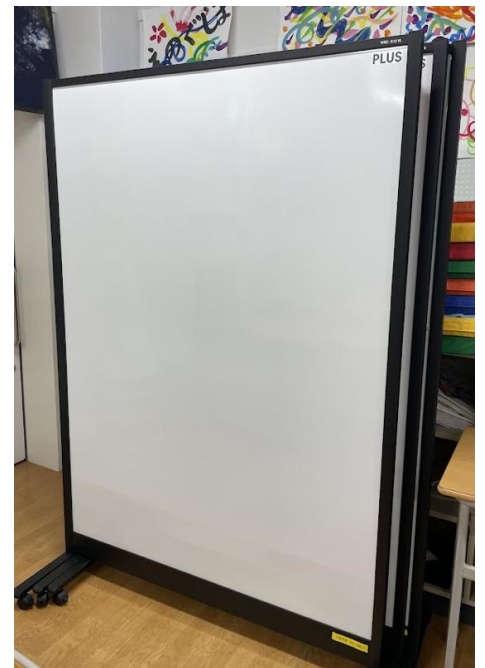
【研究発表のレイアウト例】

○ポスターは、下記のレイアウト例を参考に、発表内容をわかりやすくまとめてください。なお、レイアウト例はあくまでも参考例ですので、発表内容に応じて自由にレイアウトしてください。