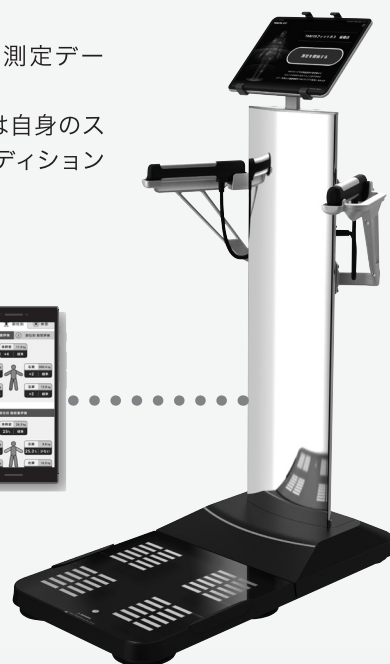
プロフェッショナル体組成計 MC-800