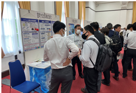
企業展ブースでの展示・説明 (ポスター発表／企業展会場)