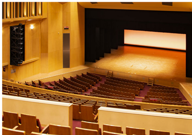
企業PRプレゼン会場 (大ホール) ※企業展ブースプレミアムのみ対象