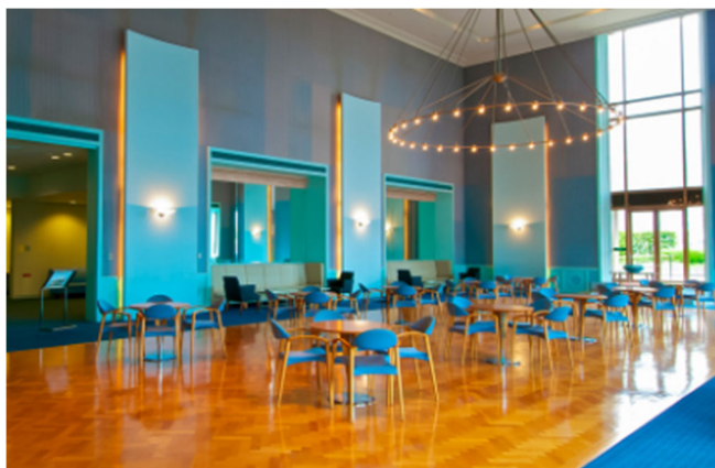
展示ブース会場(現在調整中)