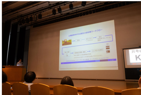
企業PRプレゼン (口頭発表会でのプレゼンテーション)